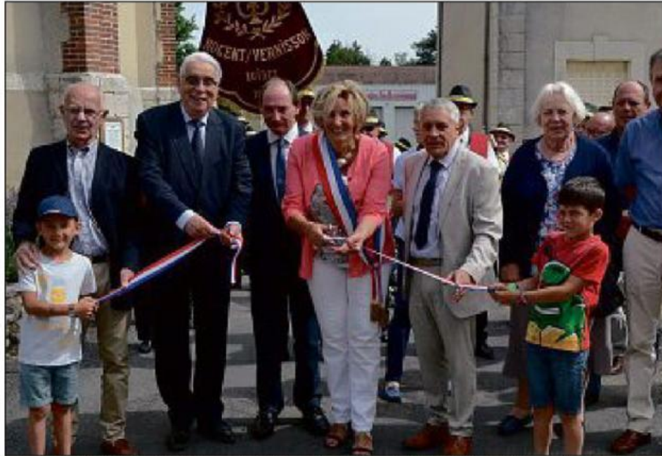
Coupe du ruban tricolore entre église et mairie, avant la visite par les personnalités des exposants sur près de 2 km.

Ce qui n'a pas empêché à la manifestation en elle-même de se dérouler dans de bonnes conditions, commençant dès le samedi soir par une retraite aux flambeaux suivie du feu de la Saint-Jean aux étangs. Le lendemain, s'installait tout au long de la rue Georges-Bannery le grand déballage commercial et artisanal, qui sous un beau soleil, a connu son succès habituel.