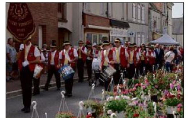
La musique parmi les fleurs rue Aristide-Briand.

communauté de communes ont également salué les organisateurs ainsi que la vitalité artisanale et commerciale de cet événement, « une fête essentielle pour la vie économique et pour la qualité de la vie en milieu rural ». Tout en espérant que cette cité, également industrielle, demeure celle que l'on appelle souvent le « Village de l'Arbre ».