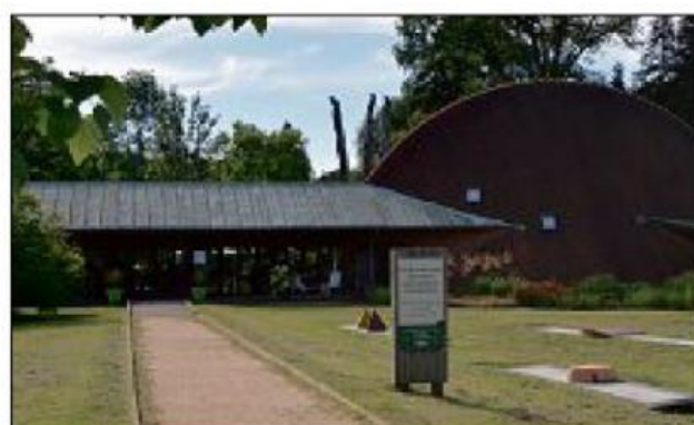
Le pavillon d'accueil de l'Arboretum des Barres.