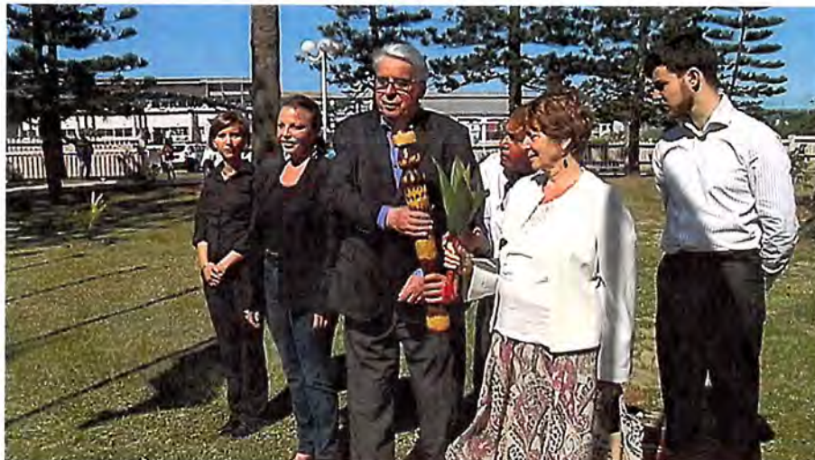
La délégation de la commission des lois du Sénat lors de la présentation de la coutume kanak au sénat coutumier

Après la commission parlementaire de l'Assemblée nationale en septembre dernier, une délégation de la commission des lois du Sénat est en visite en Nouvelle-Calédonie, à l'aube de la sortie de l'Accord de Nouméa .