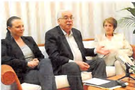
Sophie Joissains, Jean-Pierre Sueur et Catherine Tasca remettent leur rapport dans les prochaines semaines, à Paris.

Au final, les trois parlementaires semblent moins préoccupés par l'avenir institutionnel "à condition que les partis discutent dans des délais rapprochés" que par les inégalités sociales, la vie chère ou les problèmes de squats. Catherine Tasca, qui est venue plusieurs fois sur le Caillou, a retenu pour sa part les formidables changements opérés, à Nouméa et en province Nord. "C'est un territoire en mouvement et seules les Loyauté semblent rester à l'écart." Sophie Joissains a insisté sur la nécessité que la liste électorale référendaire soit établie de façon irréprochable. Dans leur rapport, les trois parlementaires relaieront une remarque maintes fois entendue : que la mission Christnacht-Merle soit teintée d'un peu plus de pluralisme, même si c'est la gauche qui, en 1988 comme en 1998, a le plus fait avancer le dossier calédonien.