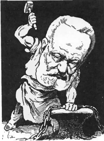
«Le vieux briseur de fers», André Gill, La Petite Lune. À propos de l'amnistie.