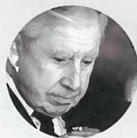
Augusto Pinochet CLOS Pas de procès suite à son décès CHILI

À quelques milliers de kilomètres, les bombes pleuvent sur l'Ukraine. Depuis février, une frénésie judiciaire inédite s'est emparée de l'Europe. Tandis qu'à Kiev, la justice ukrainienne condamne son premier suspect de crimes de guerre, de nombreux parquets européens se sont lancés dans une chasse aux preuves, jusqu'à la CPI elle-même. La France n'est pas en reste et dépêche des équipes en soutien à l'enquête de la CPI, mais s'en tient en interne à ses prérogatives nationales : alors que l'Allemagne, la Norvège, la Suède et d'autres ont ouvert dès le mois de mars des enquêtes « structurelles » – soit de vastes investigations cherchant à déterminer les responsabilités des crimes commis sur le territoire ukrainien – les six enquêtes préliminaires ouvertes en France concernant, elles, des victimes françaises. – L. B.