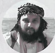
Nabil Greseque MIS EN EXAMEN Crimes contre l'humanité, génocide SYRIE