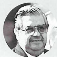
Manuel Contreras CONDAMNÉ (CONTUMACE) Disparitions forcées et torture CHILI