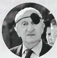
Paul Aussaresses CLOS Torture FRANCE