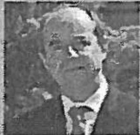
Jean-Jacques Urvoas, ancien ministre de la Justice

« Les gouvernements vivent ces études comme une justification a priori d'une décision politique. »