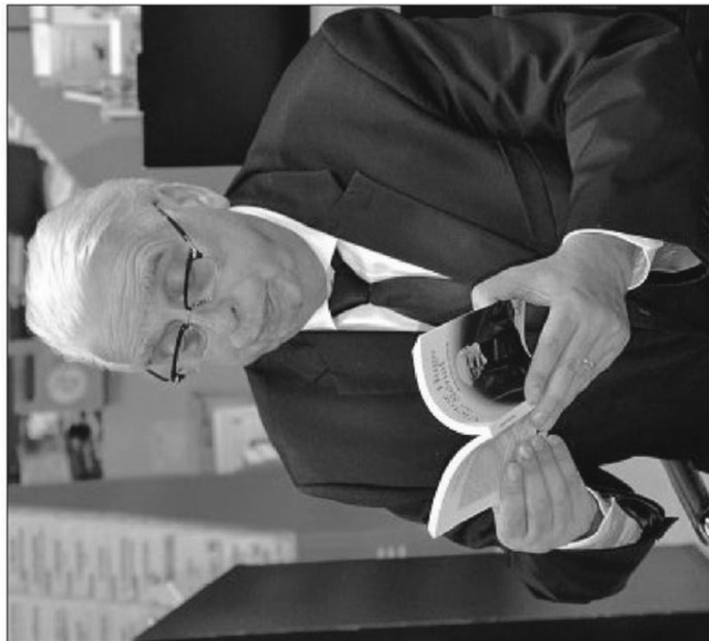
Chez lui, Jean-Pierre Sueur relit l'œuvre de Charles Péguy.

Il travaille aussi dans sa permanence, à Orléans, où il se rend muni de son attestation de déplacement dérogatoire. Et, comme il « va très bien », le vice-président de la commission des lois a été désigné membre de la mission de suivi sur la mise en œuvre de l'état d'urgence sanitaire, votée par le Parlement pour faire face à l'épidémie du Covid-19. Ce qui l'astreint à siéger à la Haute assemblée trois ou quatre jours par semaine. Mais aussi à participer à de nombreuses réunions en audio ou vidéo conférences, dont la