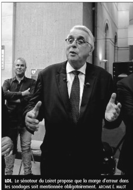
LOI. Le sénateur du Loiret propose que la marge d'erreur dans les sondages soit mentionnée obligatoirement.

C'est pourquoi, au Sénat, et plus particulièrement avec notre groupe Socialiste, Écologiste et Républicain, nous avons propo-