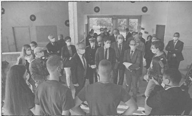
Mercredi 2 septembre, à Amilly. À l'occasion de la rentrée scolaire, le ministre de l'Agriculture et de l'Alimentation, Julien Denormandie, a visité le lycée agricole du Chesnoy.

La République du Centre - 3 septembre 2020