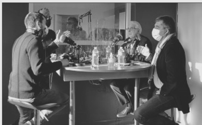
SUR LES ONDES. Le maire s'est rendu dans les locaux de la Radio Vag pour dire son discours.